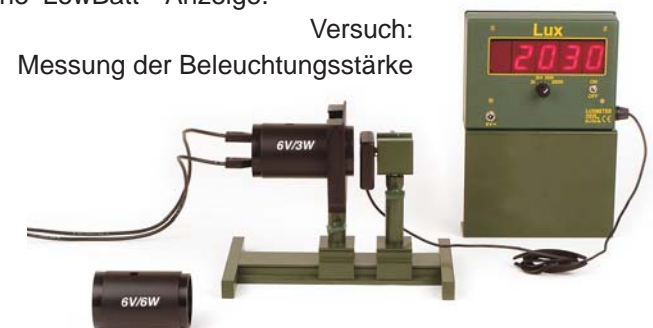
Versuch: Messung der Beleuchtungsstärke