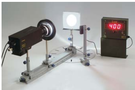
Versuch: Lambert'sches Gesetz